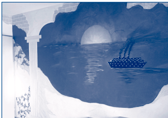
Personnaliser une chambre avec un décor «incassable»: une fresque réalisée par le peintre de la Cité du Genévrier, pour un résident, sur un motif choisi avec lui.

Un grand MERCI à tous ces «travailleurs de l'ombre» qui, chacun à leur manière, œuvrent aussi au bien-être des personnes qui vivent à la Cité du Genévrier!