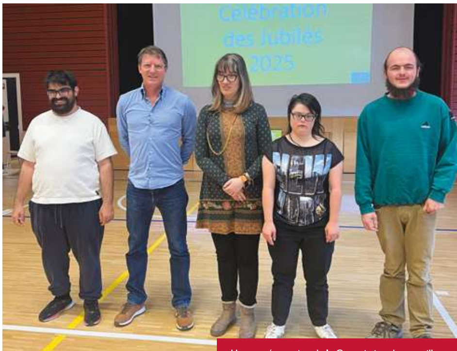
Une représentation de la Commission des travailleurs

C'était une excellente fête. L'ambiance était vraiment là. Le repas était très bon. On a pu bien danser, il y avait une belle animation et une bonne musique.