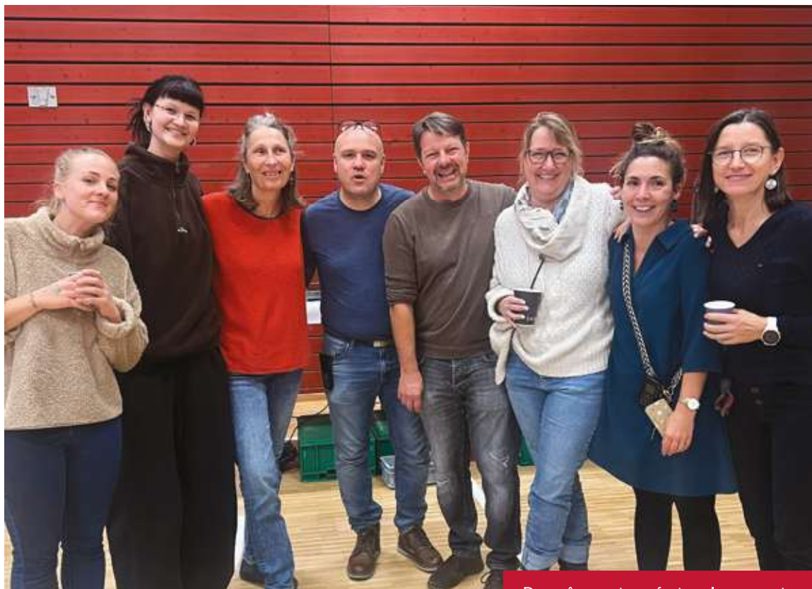
Des maîtres socio-professionnels tous sourires

Avoir une fête tous ensemble est une belle récompense.