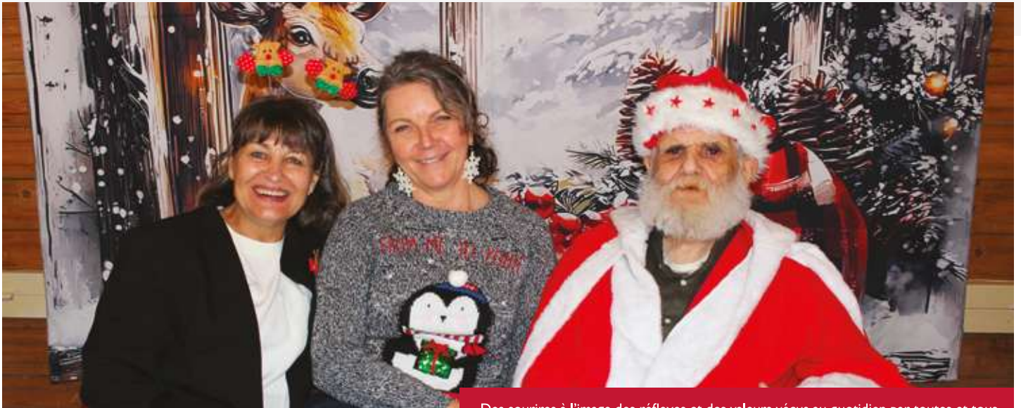
Des sourires à l'image des réflexes et des valeurs vécus au quotidien par toutes et tous