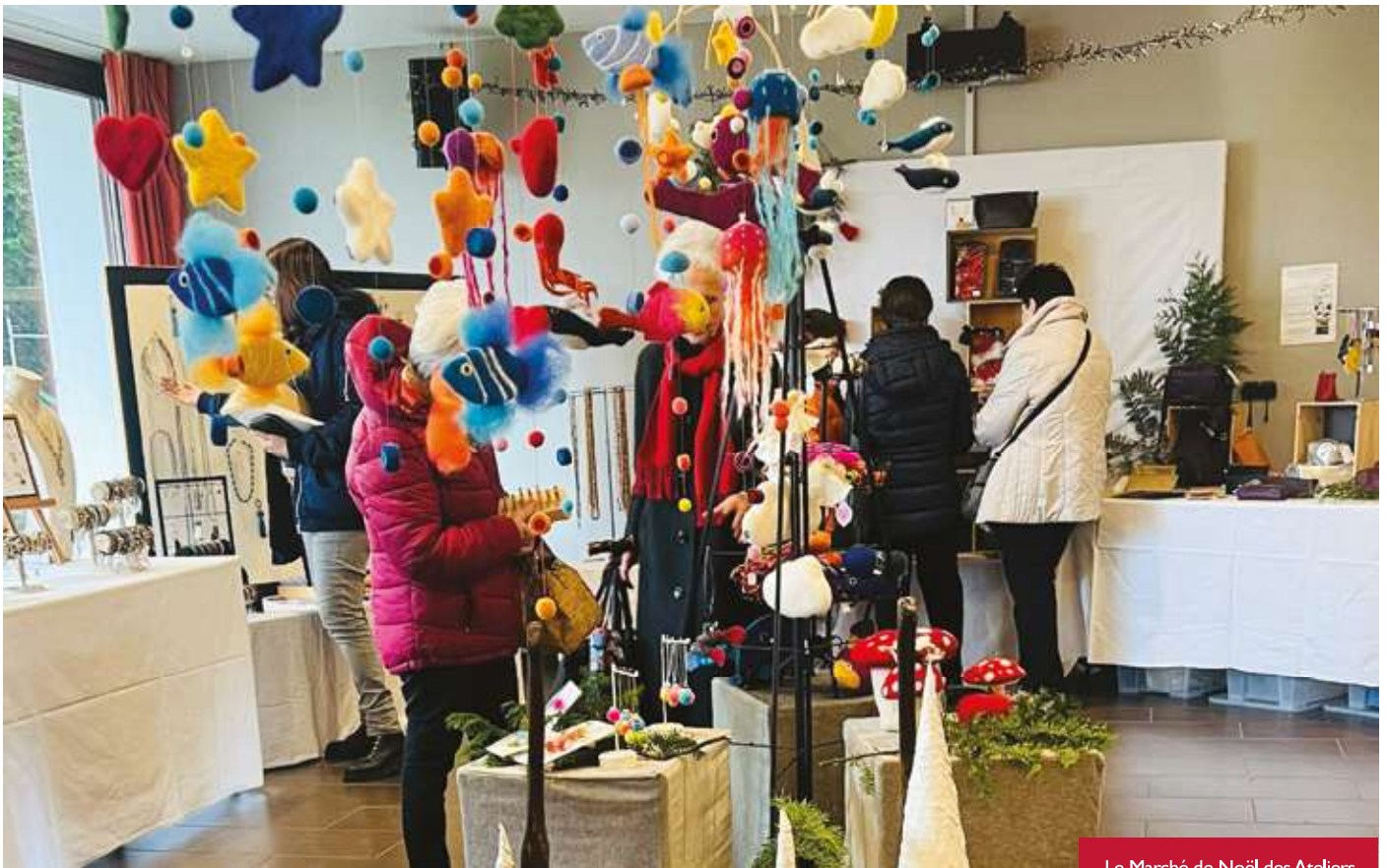
Le Marché de Noël des Ateliers