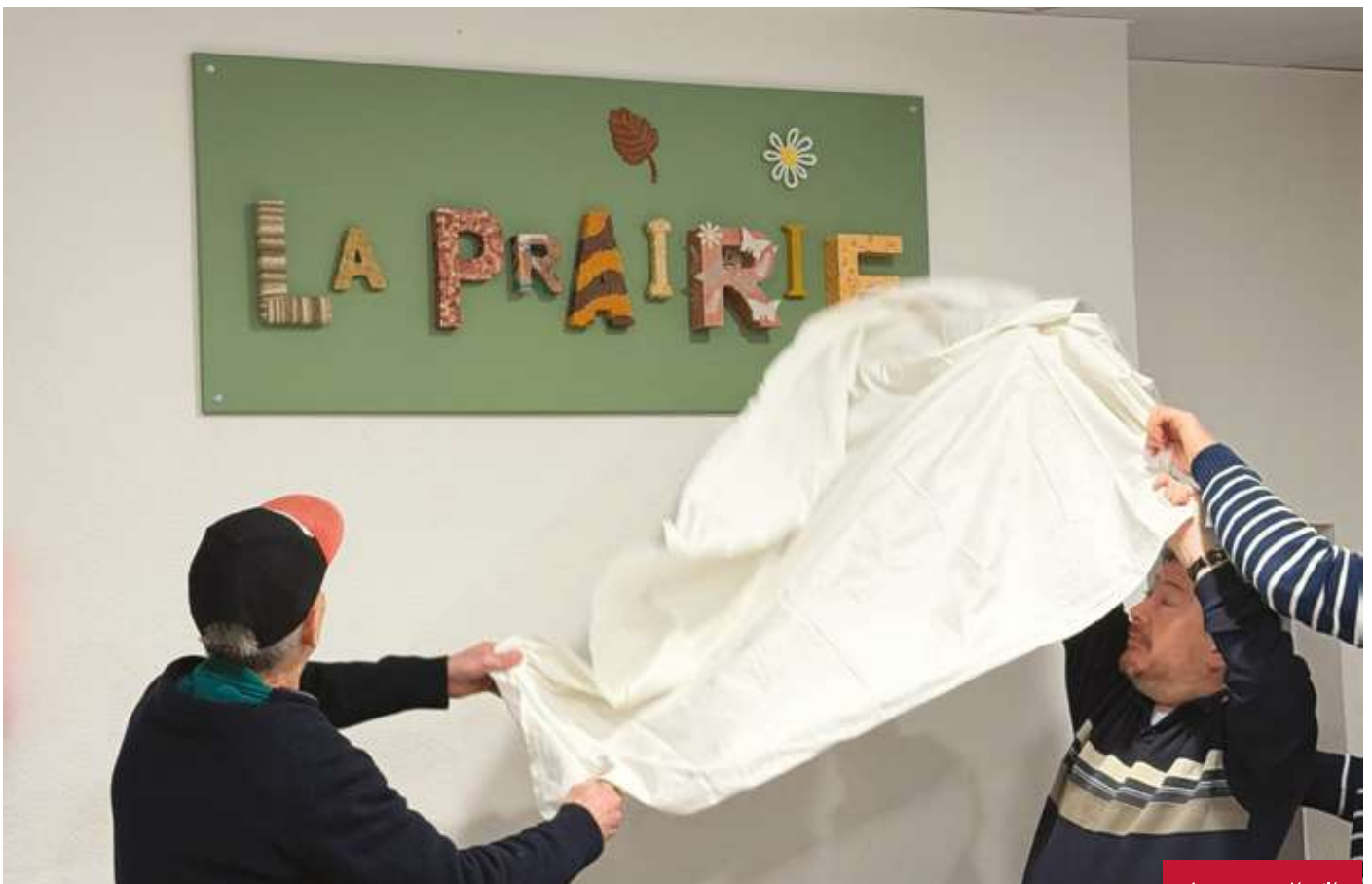
Le nom est dévoilé