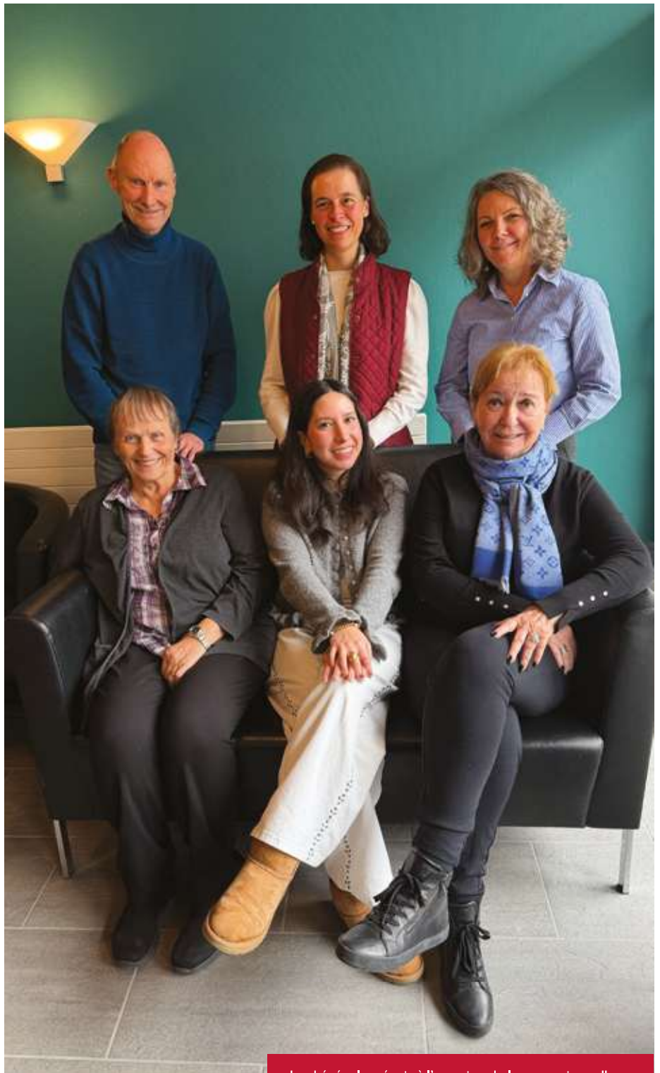
Les bénévoles réunis à l'occasion de leur premier colloque