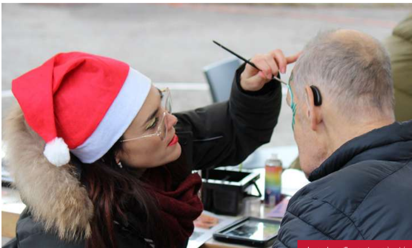
Le stand maquillage toujours très prisé

Pour l'occasion, plusieurs chalets avaient été installés devant un majestueux sapin, richement décoré grâce au travail minutieux et créatif de l'atelier « déco ». Un décor féérique qui, par son ampleur et son éclat, n'avait rien à envier à celui du Rockefeller Center de New York.