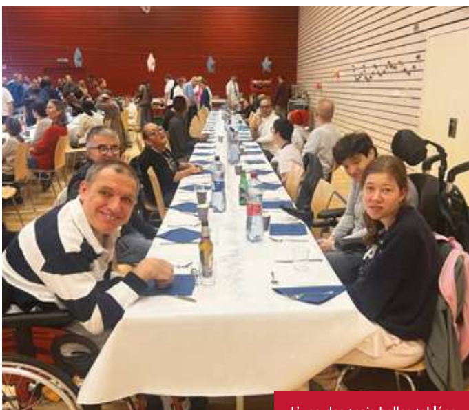
L'une des trois belles tablées