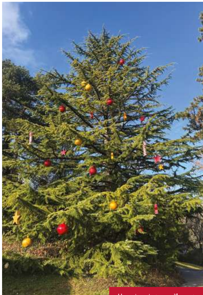
Un sapin majestueux s'il en est...

notre photographe maison. Les chalets des ateliers et centres de jour ont quant à eux attiré les visiteurs curieux de découvrir et d'acquiescer les réalisations proposées.