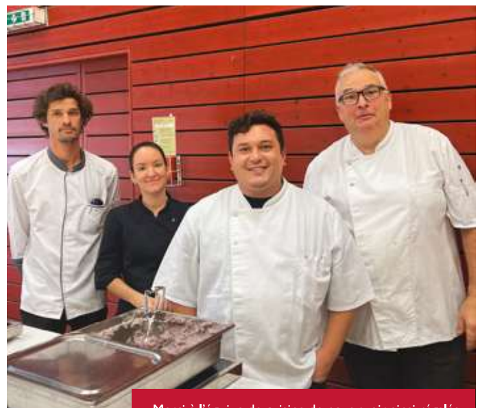
Merci à l'équipe de cuisine de nous avoir ainsi régales