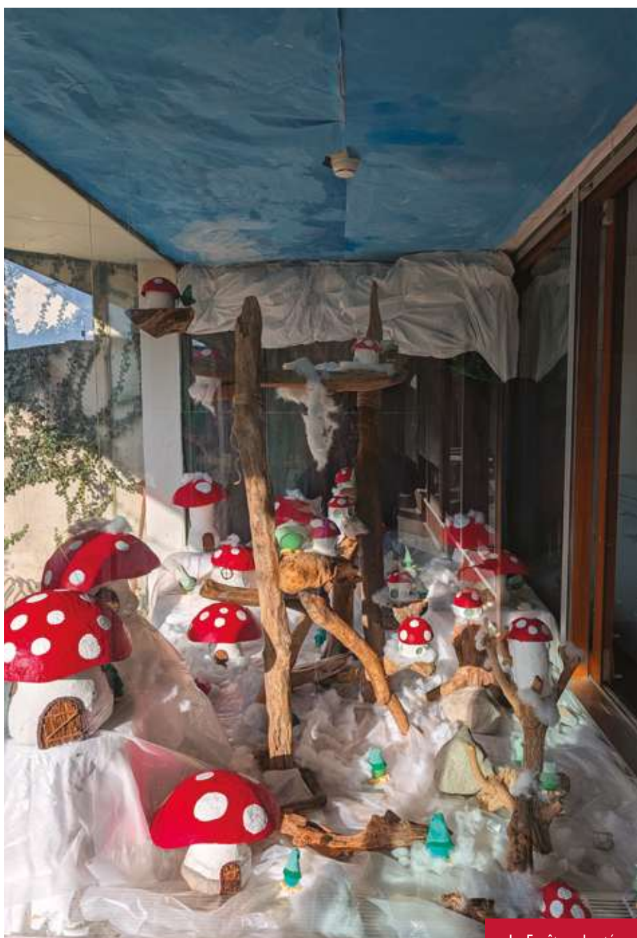
La Forêt enchantée

Un cheminement en images que nous sommes heureux de vous proposer dans cet article, pour prolonger la découverte de ces moments partagés au cœur de la Cité.