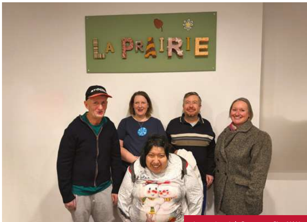
Les membres de la Commission C'est MA Vie