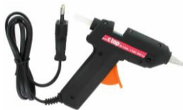
Pistolet à colle