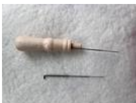
Aiguille à piquer