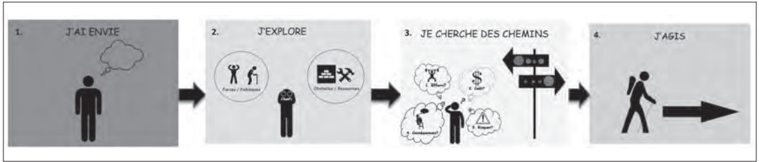
Figure 1 : étapes sous-tendant le processus d'au- todétermination

est demandé d'identifier ses propres forces et ses faiblesses personnelles, ainsi que les ressources et les obstacles qui sont liés à son environnement. Des fiches supplémentaires ont été activées pour aider la personne à réfléchir et lui permettre de personnaliser sa réalité. Après cette étape d'exploration, la personne était appelée, lors de la troisième étape, à imaginer plusieurs solutions possibles en vue de réaliser ses objectifs. Dans cette étape, et afin d'aider la personne à choisir la meilleure solution, la personne a été invitée à évaluer les solutions envisagées et à les comparer en fonction de plusieurs critères : l'effort requis, le coût, le risque et les conséquences. Pour cette évaluation, la personne a été formée à l'utilisation d'un outil de pondération. Elle devait évaluer la faisabilité de la solution en fonction de chaque critère. Au terme de cette troisième étape, la personne était invitée à sélectionner la solution la plus prometteuse lui permettant d'avancer dans la réalisation de son projet ou de son envie. La quatrième étape correspondait à la mise en pratique