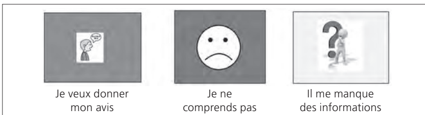
Figure 2 : matériel mis à dis- position de la per- sonne pour soute- nir sa participation à la discussion

Concernant la participation citoyenne, nous nous sommes focalisés sur le développement des compétences nécessaires pour 1) s'exprimer en groupe (se faire comprendre, argumenter, respecter l'avis des autres, etc.); 2) connaître ses droits (lois cantonales, fédérales, internationales, normes institutionnelles) et ses devoirs et 3) accepter le conflit, être attentif à ne pas se faire manipuler, etc. Bien que nos interventions aient été accompagnées de plusieurs notions théoriques, elles ont surtout été un lieu où les participants se sont exercés à développer ces compétences. Nous avons créé des cartes « méta-communicatives » afin de favoriser la participation à la discussion et aux échanges (Figure 2).